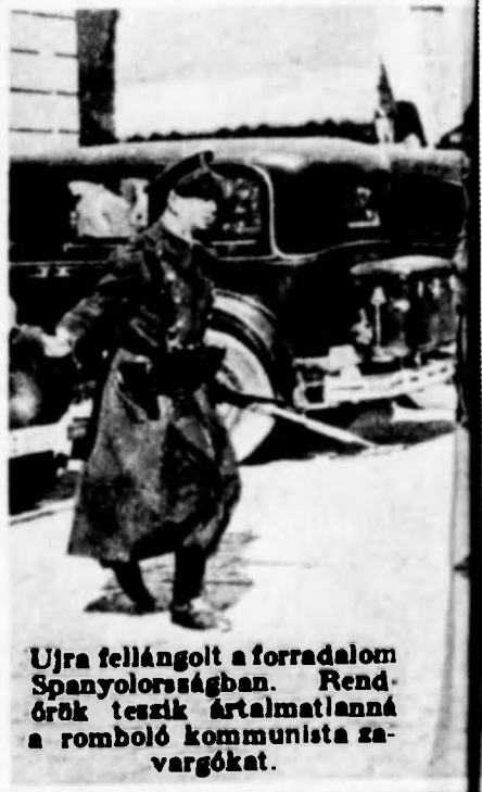
Ujra fellángolt a forradalom Spanyolországban. Rendőrök teszik ártalmatlanná a romboló kommunista zavargókat.