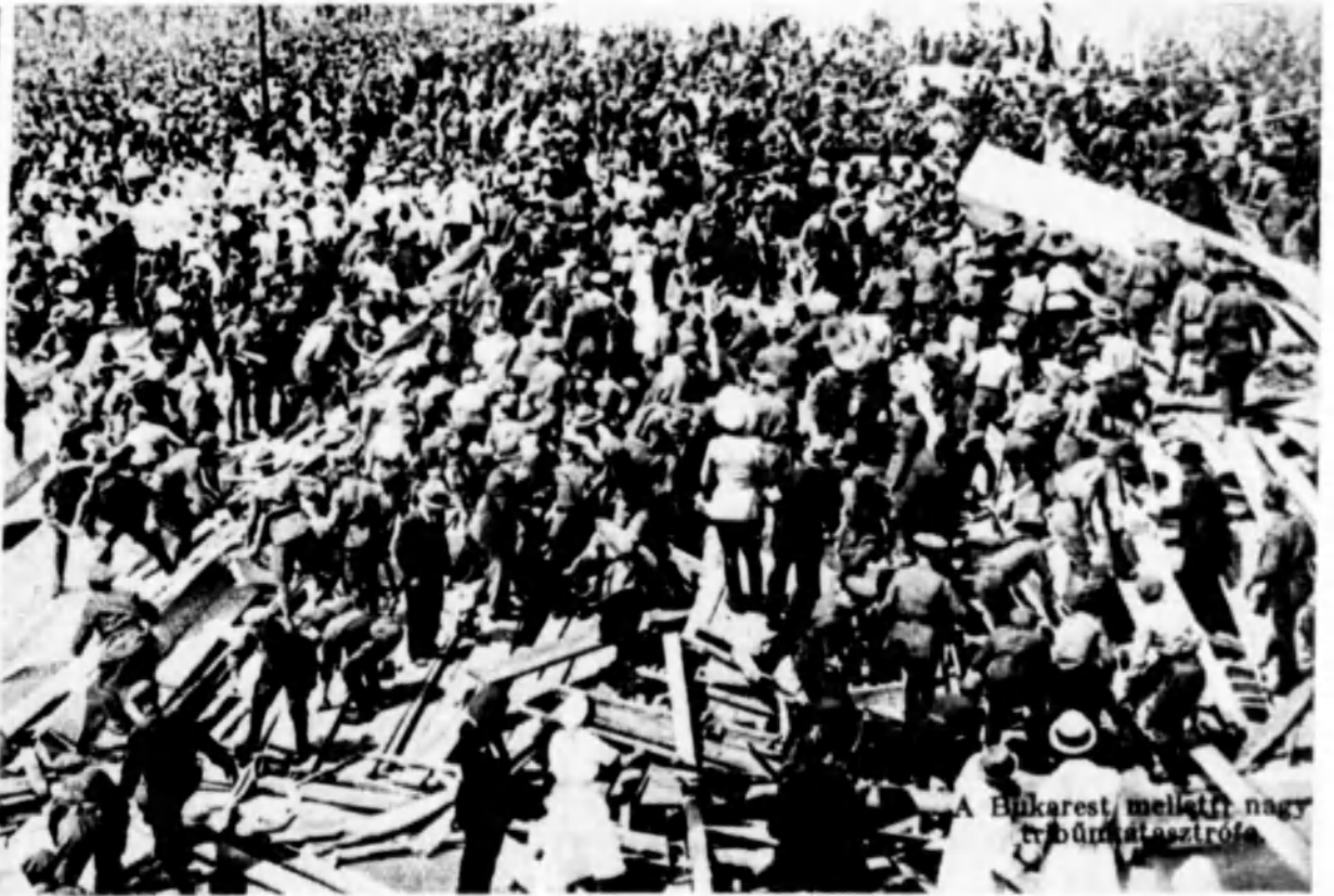
A Bukarest melletti nagy trófeaünnep.