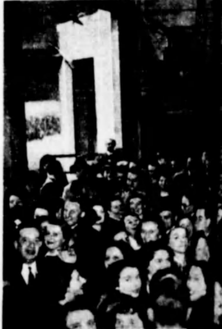
Mulatozó sztrájkolók egy párizsi áruház személyzeti osztályán, a nagy francia sztrájk alatt.