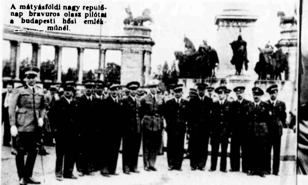
A mátyásföldi nagy repülőnap bravuros olasz pilótái a budapesti hősi emlékműnél.

Allattenyésztésnél Pekk és Futor nélkülözhetetlen! (CHINA, UJPEST)