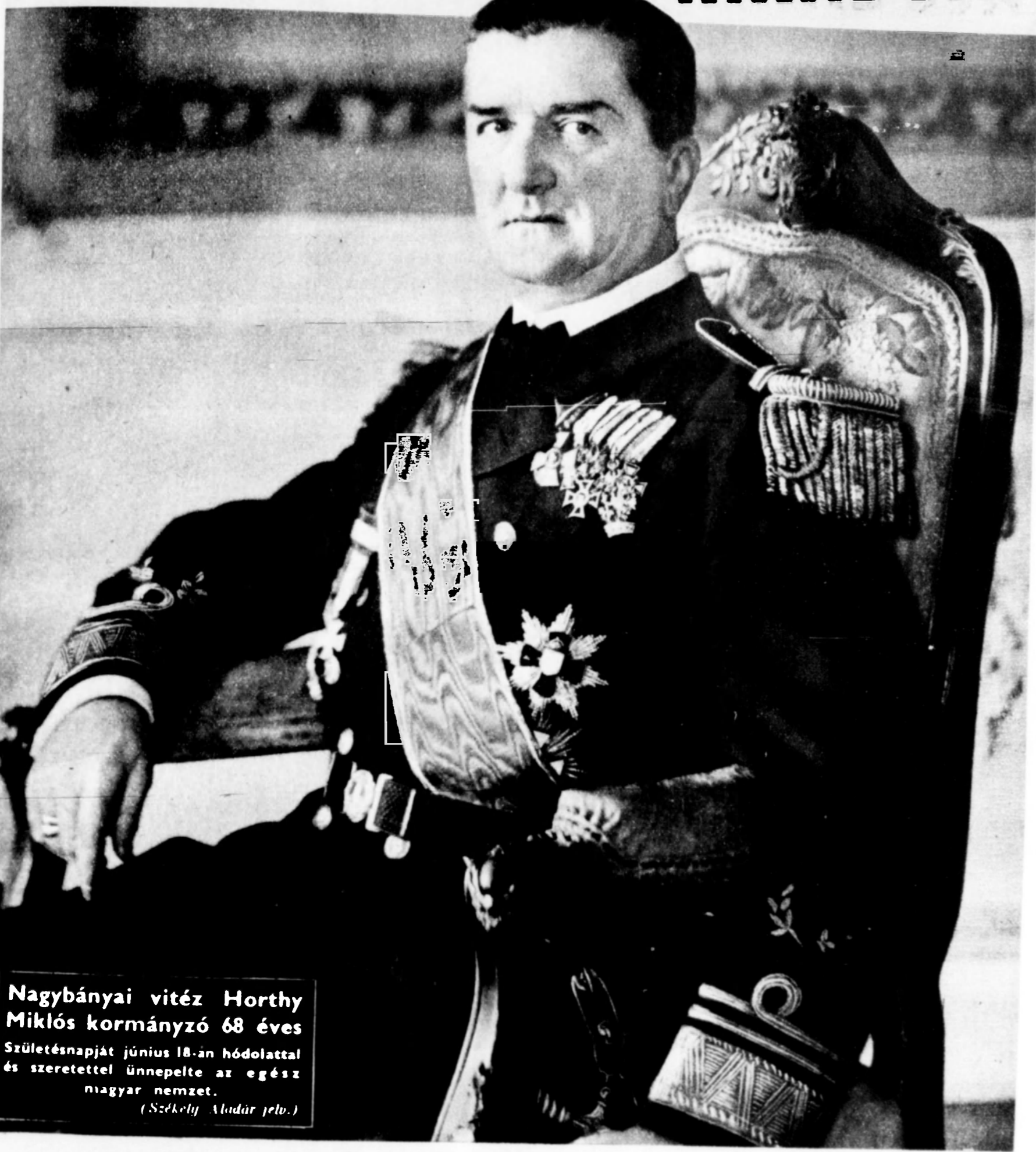
Nagybányai vitéz Horthy Miklós kormányzó 68 éves Születésnapját június 18-án hódolattal és szeretettel ünnepelte az egész magyar nemzet.

te tő va pr ki eg eg kit ba his Mi nye nik dal ten elő. eln je iz lhu mre ezc