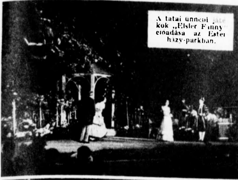
A tatari unneki játékok „Első Fény” előadása az Esterházy-parkban.