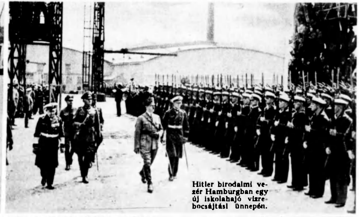
Hitler birodalmi ve- zér Hamburgban egy új iskolahajó vízre- bocsátási ünnepén.