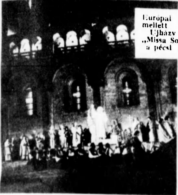
Europai érdeklődés mellett játszottak Ujbázy György „Missis Sollemis”-ét a pécsi dómterem.