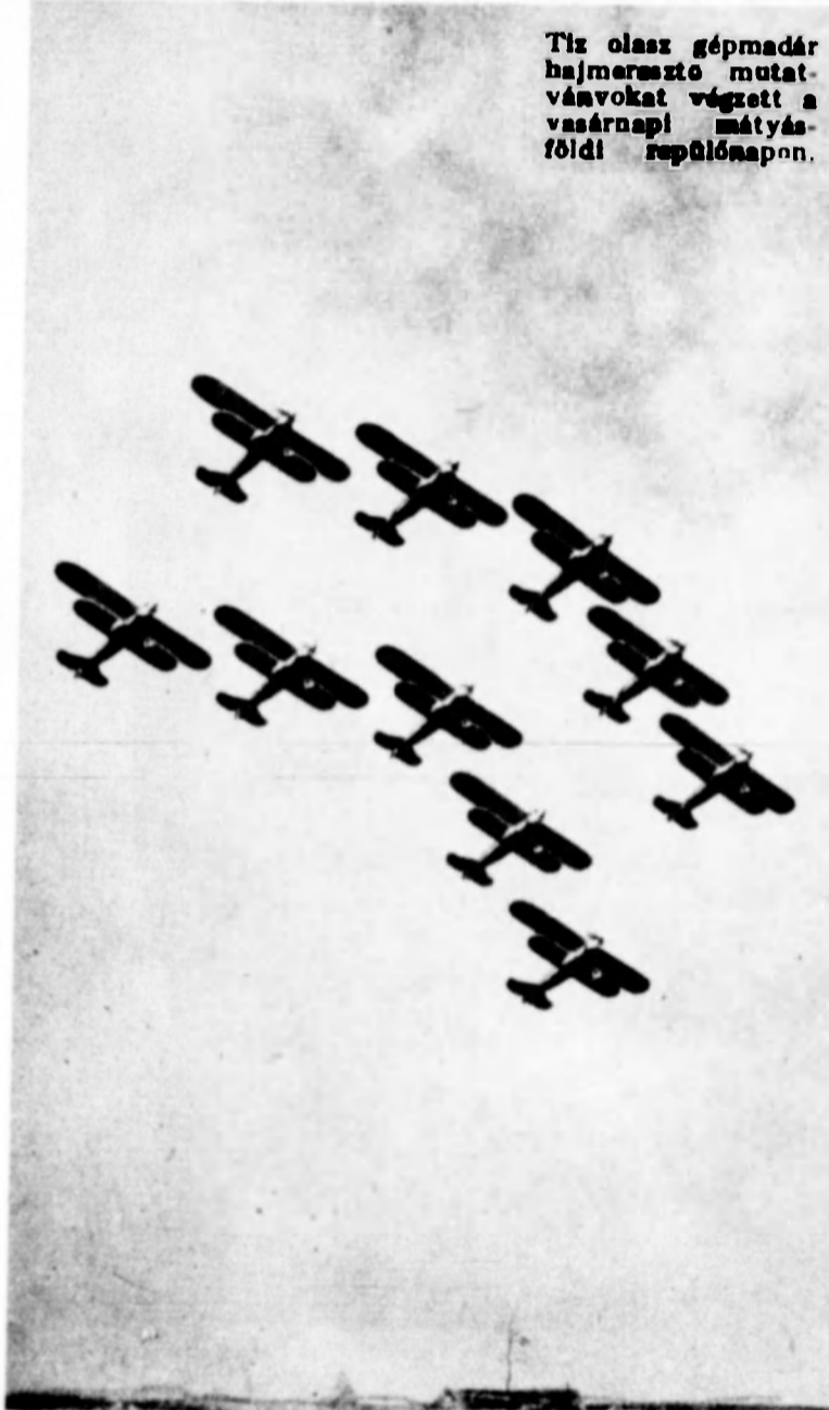
Tíz olasz gépmadár hajmeresztő mutatványokat végzett a vasárnapi mátyásföldi repülőnapon.