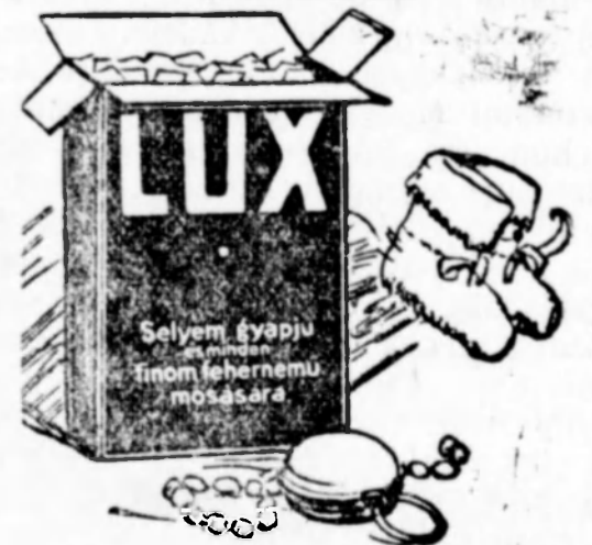
A SUNLIGHT-mávek gyártmánya.

Valódi Lux csak zárt kék dobozban kapható!